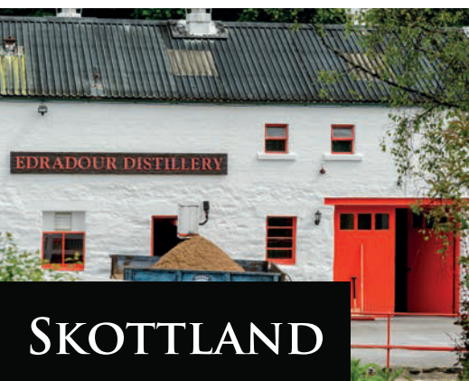
Pitlochery, Edradour Distillery.