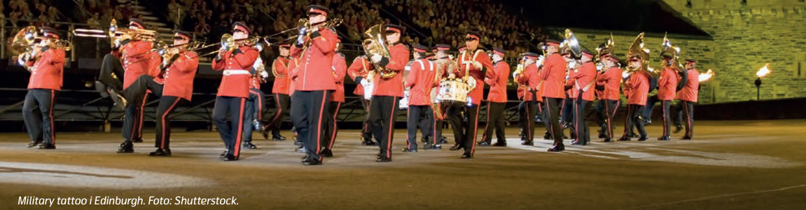
Military tattoo i Edinburgh.