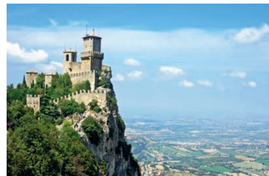
San Marino - Rocca della Guaita.