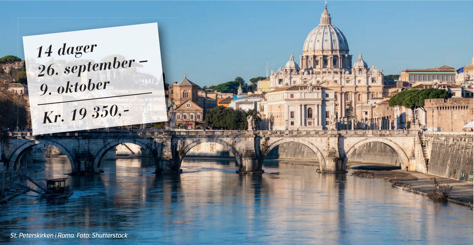
St. Peterskirken i Roma.