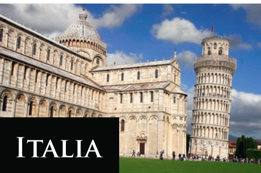
Det skjeve tårnet i Pisa.